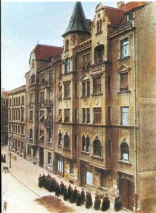
Erstes Mutterhaus München-Maistraße