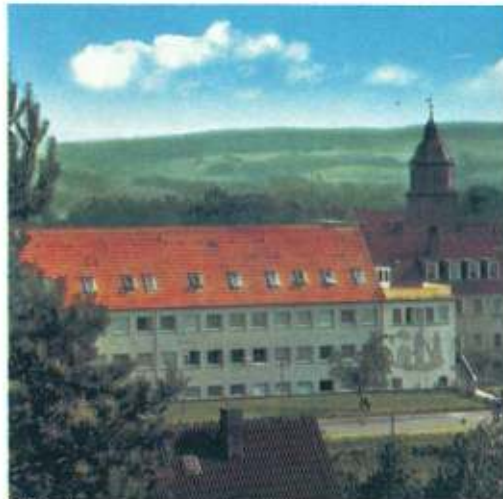
Herleshausen; ökumenischer Einsatz an der Zonengrenze Haus Elisabeth, Schwesternwohnheim in München-Nymphenburg