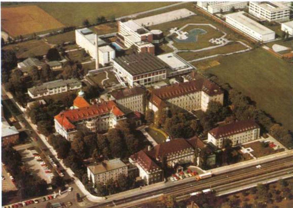
Luftansicht: Krankenhaus-Areal München-Nymphenburg — 1977