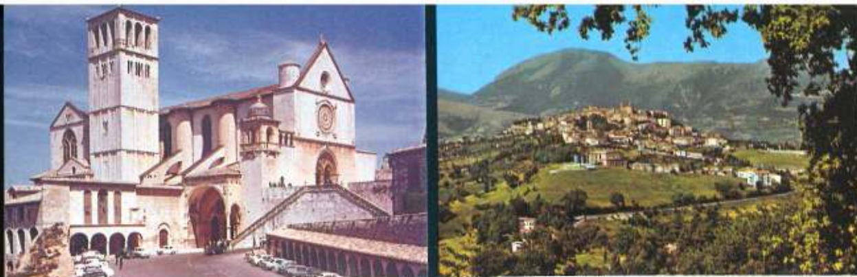
Assisi und Camerino