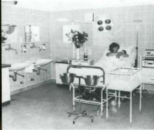
Im modernisierten Kreißaal