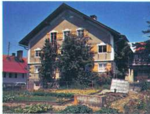
Erholungsheim Bihlerdorf im Allgäu