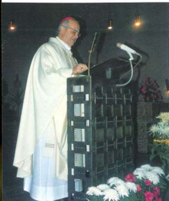
Hochw. H. Weihbischof Defregger bei der Ansprache Schwestern beim Festgottesdienst