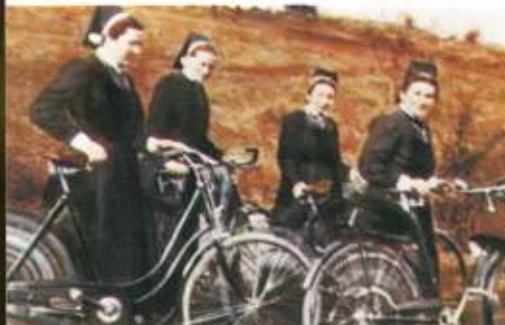
Unterwegs mit dem Rad Die Schwester sorgte für alle