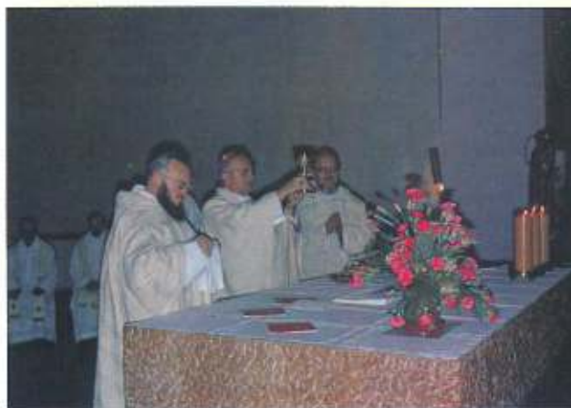
Während der Wandlung