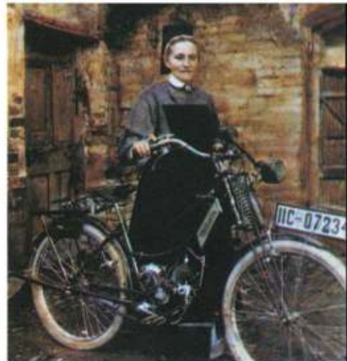
Sie fahren schon mit dem Motorrad