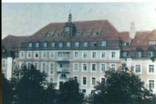
Franziskushaus als Erweiterungsbau in München-Nymphenburg Bombenangriff auf das Krankenhaus in München-Nymphenburg