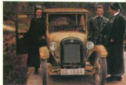
Mit dem Auto auf vielen Straßen unterwegs Familienpflege