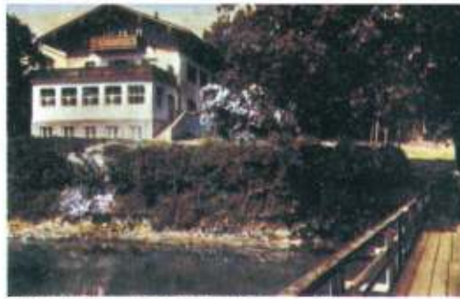
Schondorf — Erholungsheim am Ammersee