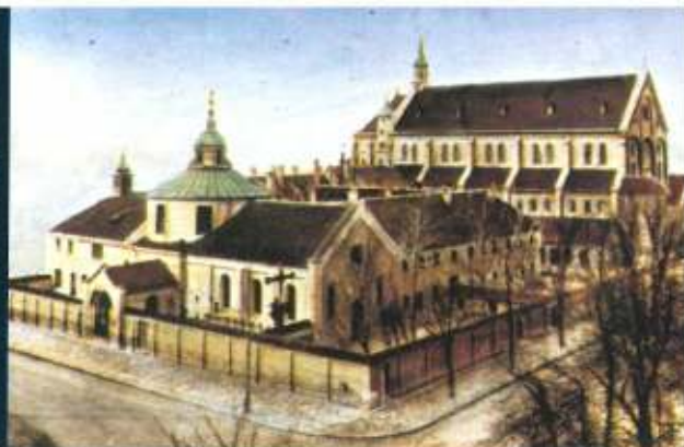
Wartburg und München-St. Anton