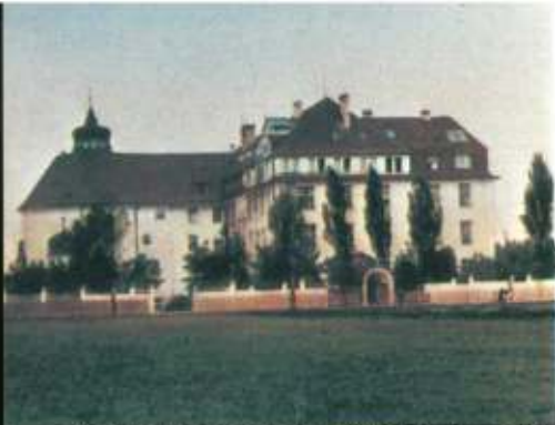
Krankenhaus München-Nymphenburg 1912