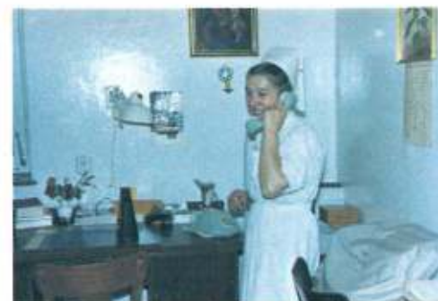
Sr. Salutaria Kinderkrankenhaus in Passau