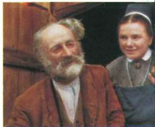
Pflege der Alten und Hilflosen